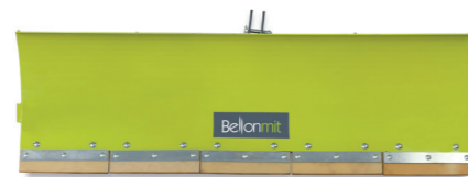
TSBL - TSBM LAMA SGOMBRANEVE SNOW PLOUGHS SCHNEEPFLÜGE LAME CHASSE-NEIGE