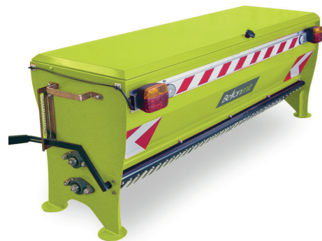
TPZ SPARGISALE A SOLLEVAMENTO SALT SPREADER SALZSTREUER EPANDEUR DE SEL