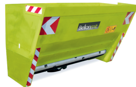
TPP SPARGISALE AUTOCARICANTE SELF LOADING SALT SPREADER SELBSTLADE-SALZSTREUER EPANDEUR DE SEL AUTOCHARGEANT