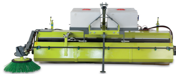
TSPH SPAZZOLA IDRAULICA ANTERIORE O POSTERIORE SWEEPER FRONT OR BACK HYDRAULIC SYSTEM FRONT- und HECK-KEHRMASCHINE MIT HYDRAULISCHEM ANTRIEB BALAYEUSE HYDRAULIQUE