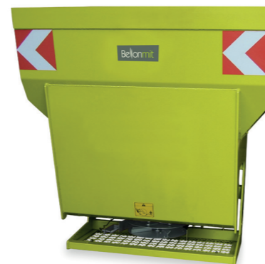
TPR SPARGISALE AUTOCARICANTE PIATTO ROTANTE SELF LOADING SALT SPREADER WITH SPINNER DISC SELBSTLADE-SALZSTREUER MIT STREUSCHEIBE EPANDEUR DE SEL AUTOCHARGEANT À DISQUE