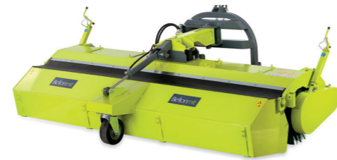
TSPK SPAZZATRICE SWEEPER KEHRMASCHINE BALAYEUSE