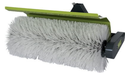
TSPS SPAZZOLATRICE SWEEPER KEHRMASCHINE BALAYEUSE