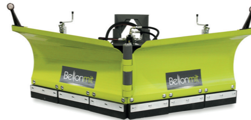
TSBV LAMA SGOMBRANEVE VOMERE V-SNOW PLOUGH KEILSCHNEEPFLUG CHASSE NEIGE EN V