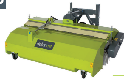
TSPF SPAZZOLA ANTERIORE SWEEPER FRONT FRONT-KEHRMASCHINE BROSSE ANTÉRIEURE