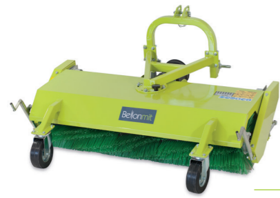
TSPP SPAZZOLA POSTERIORE SWEEPER BACK HECK-KEHRMASCHINE BALAYEUSE ARRIÈRE